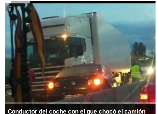
Conductor del coche con el que chocó el camión

http://andaluciainformacion.es/ hace 179 días