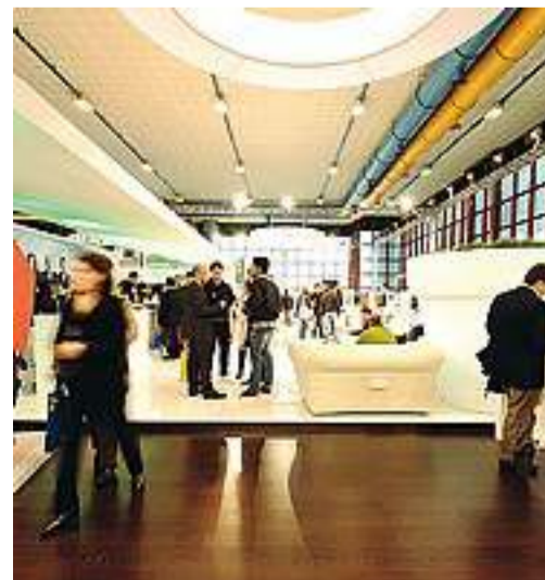
Nei padiglioni EnergyMed alla Mostra d'Oltremare

Ma non solo. EnergyMed 2017, organizzato dall'Agenzia Napoletana Energia e Ambiente, è ormai appuntamento di riferimento nel Sud per lo sviluppo dei prodotti e delle policy di sostenibilità ambientali e rilancia la sfida presentando prodotti innovativi di aziende