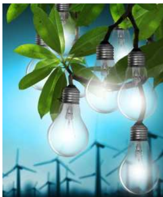
SET-UP pretende mejorar la gestión de la demanda energética, lo que dará lugar a la reducción del consumo de energía y al incremento de la seguridad energética.

La Comisión Europea acaba de aprobar el proyecto europeo SET-UP , enmarcado en la iniciativa Interreg Europe 2014-2020 y en el que la Agencia Andaluza de la Energía va a participar como socio . Con una dotación presupuestaria de 1.632.854 euros y una duración de cinco años, este proyecto pretende mejorar la eficiencia energética de las regiones involucradas (Bretaña francesa, Transdanubio Sur en Hungría, Algarve en Portugal, Kaunas en Lituania, Brittany en Francia, Leicester en Reino Unido y Andalucía en España ) mediante la investigación y gestión de redes inteligentes de energía . Se espera, a medio y largo plazo, mejorar la gestión de la demanda energética , lo que dará lugar a la reducción del consumo de energía al incremento de la seguridad energética, junto con beneficios socioambientales y económicos asociados.