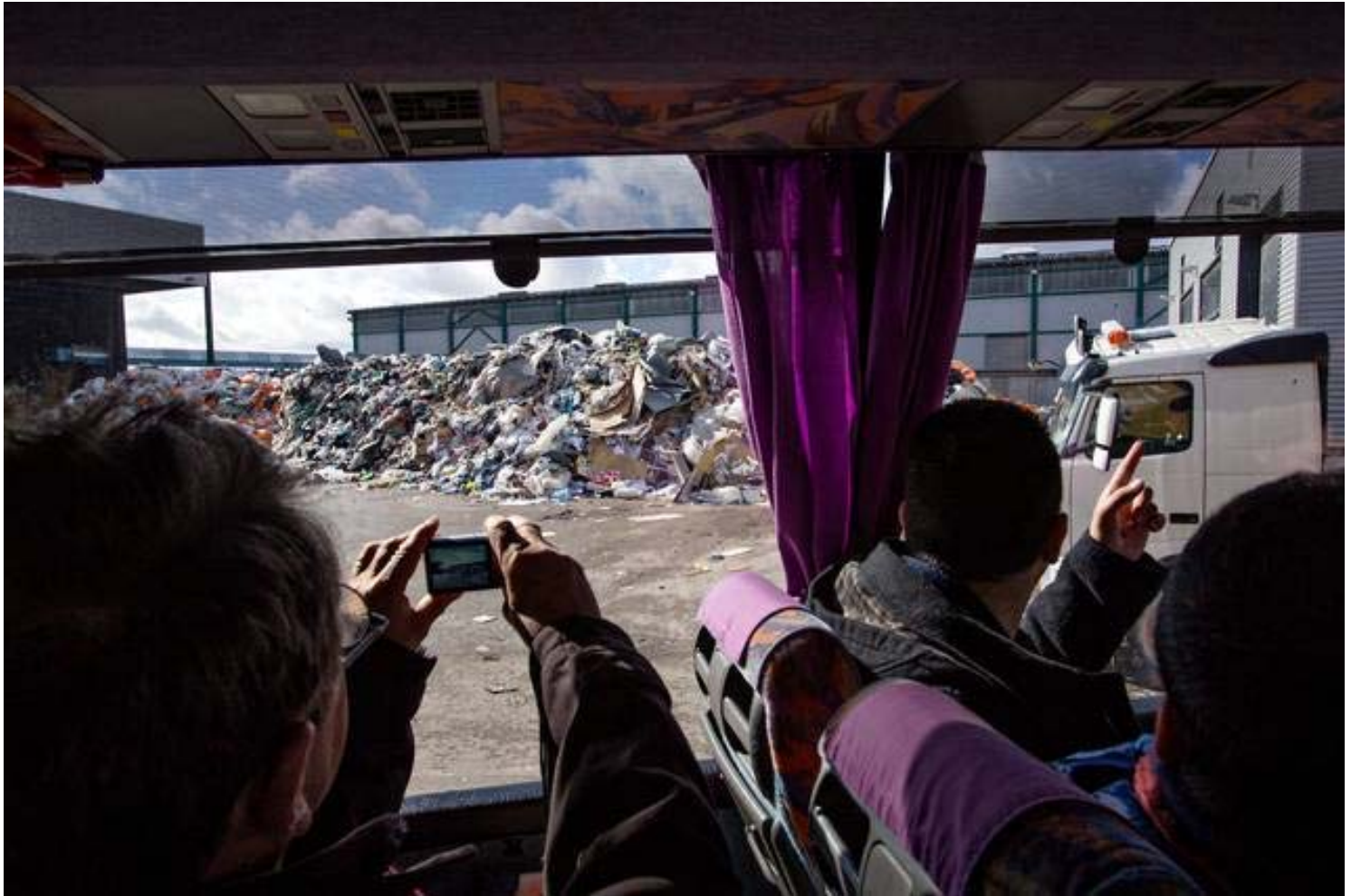
Kännykät ikuistivat näkymiä Kujalan jätekeskuksessa.

Lahden Kujalan jäteasema sai keskiviikkona kansainvälistä huomiota, kun bussilastillinen kiertotalouden asiantuntijoita kuudesta maasta kiersi alueella.