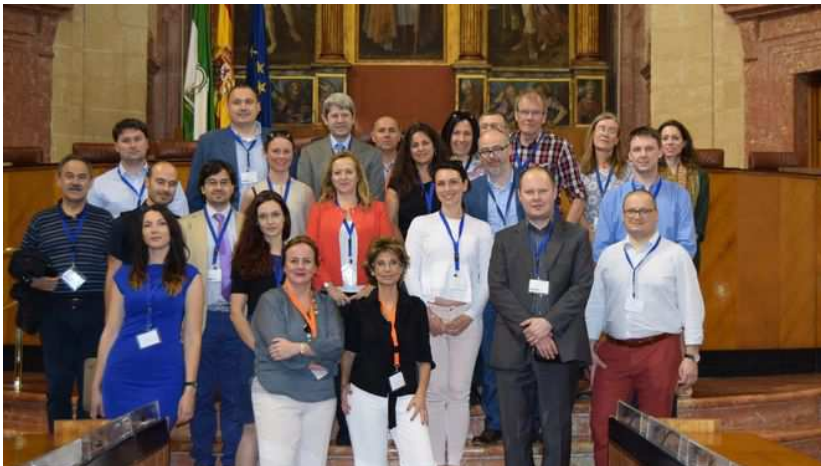
Los socios del proyecto europeo de construcción sostenible 'Build2LC' visitan el Parlamento andaluz SEVILLA | EUROPA PRESS