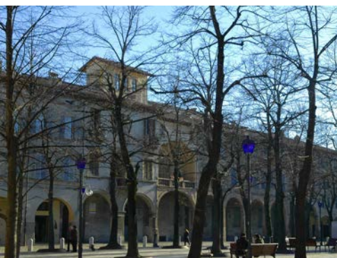
Reggio Emilia, Sala Tricolore, Ponte di Calatrava, Piazza Fontanesi

Reggio Emilia al momento è impegnata nella realizzazione del SUMP (Piano di Mobilità Urbana Sostenibile) che verrà finalizzato nel 2017 e conterrà la visione strategica del sistema di mobilità al 2030.