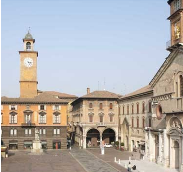
Reggio Emilia, Piazza Prampolini