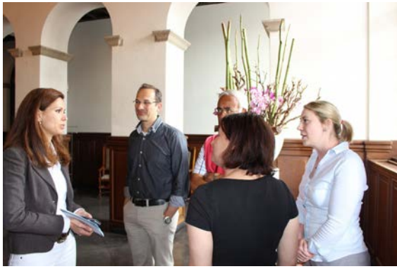
Peer Review a Roermond, Luglio 2016