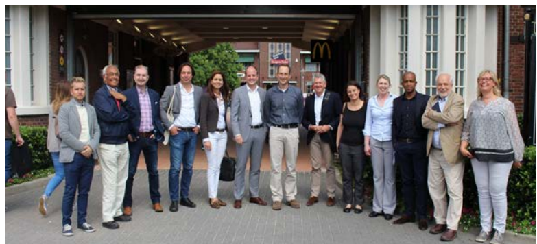
Gli esperti da Portogallo, Svezia, Regno Unito ed Olanda della Peer Review a Roermond

La cooperazione tra le regioni è il punto centrale del progetto RESOLVE. Le politiche di mobilità sostenibile sono realizzate attraverso azioni e politiche coordinate tra i vari livelli di autorità pubbliche, ma principalmente sono le autorità locali che hanno questa responsabilità. I partner del progetto hanno già messo in atto localmente eccellenti iniziative e buone pratiche. RESOLVE ha sviluppato un piano di lavoro intensivo che permetterà alle 8 autorità locali e regionali di: analizzare i rispettivi piani di mobilità attraverso le linee guida per i Piani Urbani di Mobilità Sostenibile promosse dalla Commissione Europea; identificare buone pratiche , da importare a livello locale; sviluppare un solido Piano di Azione Regionale ; ideare, testare e proporre uno Strumento di Monitoraggio e Valutazione per la valutazione ex-ante ed ex-post di politiche ed iniziative nel campo della mobilità sostenibile ed il commercio.