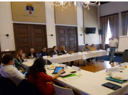
Kick Off meeting progetto RESOLVE, Roermond, Aprile 2016