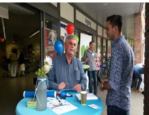
Incontri con i cittadini a Roermond