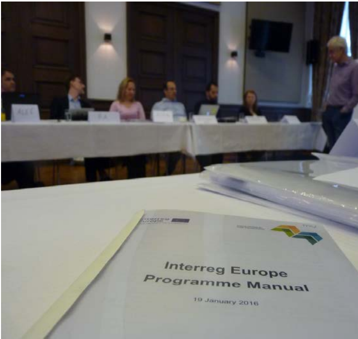
Kick Off meeting progetto RESOLVE, Roermond, Aprile 2016

Come rendere la mobilità di persone e merci più sostenibili ed efficienti dal punto di vista energetico? Come migliorare le aree commerciali in termini di rumore, traffico, inquinamento e livello di attrattività? Come possono contribuire le autorità locali e regionali al raggiungimento degli obiettivi di crescita sostenibile della strategia europea “Europa 20-20-20” per la riduzione delle emissioni ed il miglioramento dell’efficienza energetica?