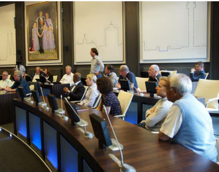
Peer Review a Roermond, Luglio 2016