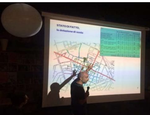
Reggio Emilia, incontri con residenti e commercianti