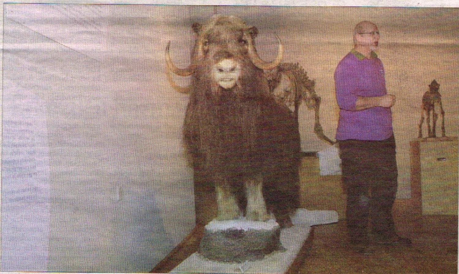
350 ezer évvel ezelőtti élő állatvilágot mutatnak be. Interaktív kiállítás

Pézsmatulok, dél-amerikai kardfogú tigris, mamutborjú, barlangi hiéna és farkas, illetve más jégkorszakbeli állatok fogadják jövő héten csütörtöktől a látogatókat a Csíki Székely Múzeumban. A Magyar Természettudományi Múzeum vándorkiállításának anyagát, az élethű állatrekonstrukciókat, hatalmas méretű csontokat és csontvázakat az elmúlt napokban rendezték el a termekben. ■ 7. oldal