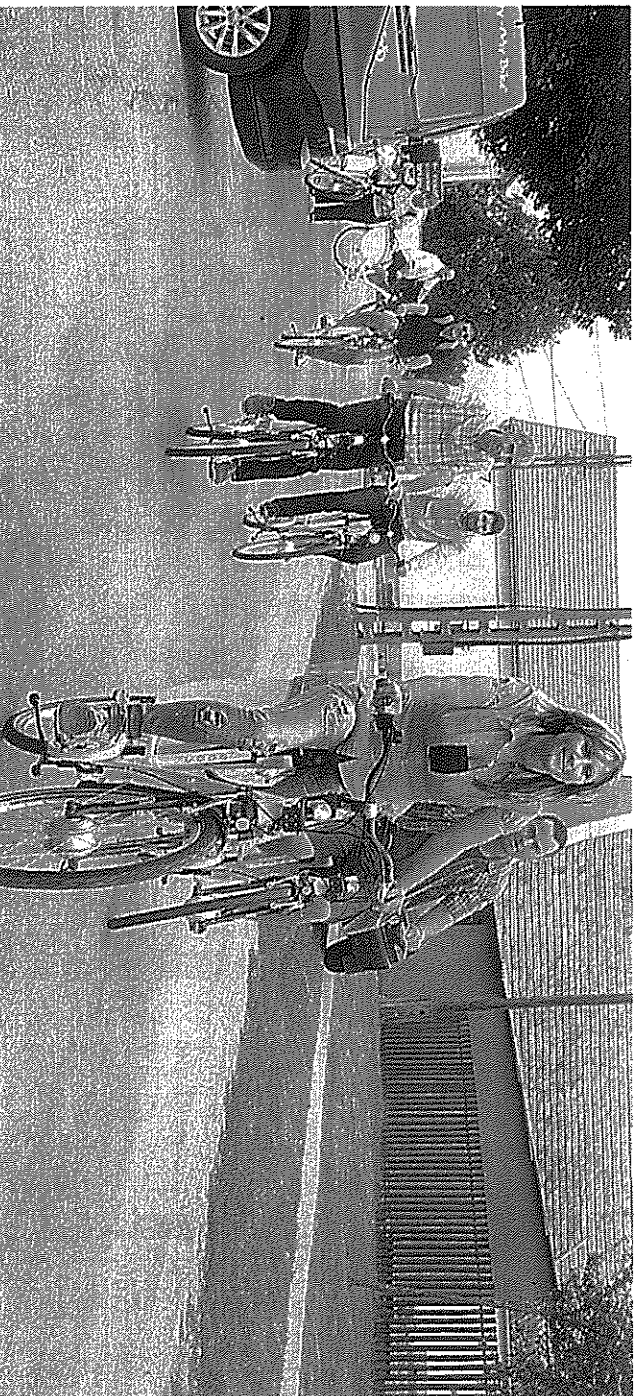
A nyertes pályázatok között ismét figyelembe a természetbarát közlekedésre, az elektromos kerékpárok használatára