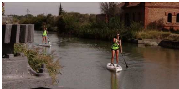
Actividad organizada por la Ruta del Vino Cigales en el Canal de Castilla.