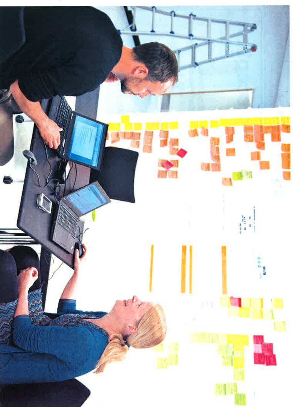
Tapetet er i en klasse for sig selv hos Syddansk Sundhedsinnovation i Forskerparken.