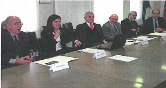
La sottoscrizione dell'accordo è avvenuta mercoledì 15 novembre

Sottoscritto mercoledì 15 novembre l'accordo di programma promosso dalla Regione Piemonte, con la Città di Torino, l'Università degli Studi di Torino, l'azienda ospedaliera-universitaria Città della Salute e la Società Fs Sistemi Urbani, per la realizzazione del Parco della Salute, della Ricerca e