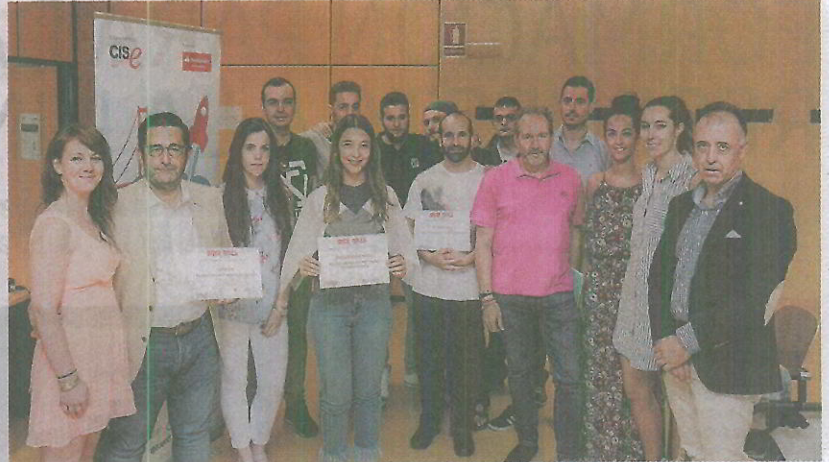
Entrega de los premios de la pasada edición del programa Yuzz.