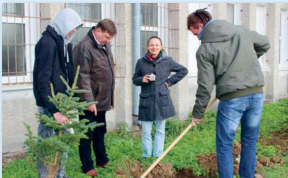
A Harc a szabadsággért és a demokráciáért napjának előestéjén a nyitrai (Nitra) Élelmiszeripari Szakközépiskola diákjai az iskola udvarán jelképesen tizenhét fát ültettek ki.

zajlottak és több tevékenységre irányultak, mint például a környezetvédelem, sport, művészeti tevékenység, illetve a kábitószes-fogyasztás és a megkülönbözte-