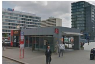
Stanice metra Budějovická

Praha 4 žádá pražský magistrát o zprůchodnění pasáže u stanice metra C Budějovická a odstranění, nebo okamžitou opravu terasy nad jižním vestibulem stanice Budějovická.