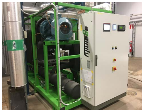
ORC-teknik från Againty.

Turbiner för småskalig elproduktion har på nytt fångat intresset hos svenska värmeverk. Idag har flera sådana maskiner installerats för att generera lokal, förnybar, väderoberoende och kostnadseffektiv el. Ronneby Miljö och Teknik AB var först med att installera Againtys ORC-system i Sverige, vid närvärmeverket i Bräkne-Hoby.