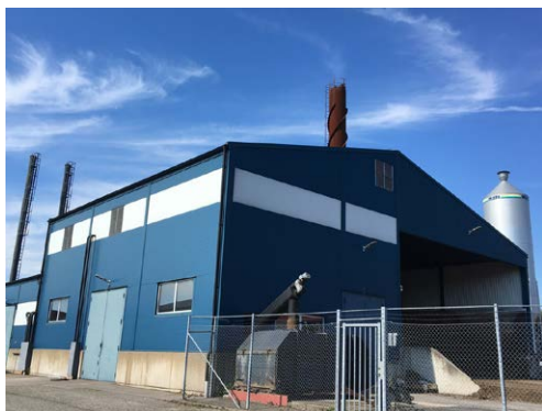
Panncentralen i Bräkne-Hoby.