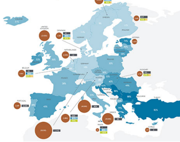
Landfills in Europe

economie agenda | bedrijfsnieuws | wetenschap | technisch | artikels | hr & werk | studeren | columns | gratis nieuwsbrief plant & factory maintenance | installatie & bouw | ir-wereld | IT & software | agro & voeding | eco & energie | healthcare | logistiek aerospace