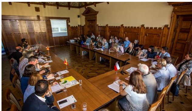
Seminarium Tematyczne w Krakowie 7-8.06.2017 r.

Podczas seminarium partnerzy projektu przedstawili dobre praktyki w zakresie deponowania odpadów komunalnych w zabytkowej części miasta oraz podczas wizyt studyjnych zapoznali się z systemem gospodarki odpadami funkcjonującym w Porto.