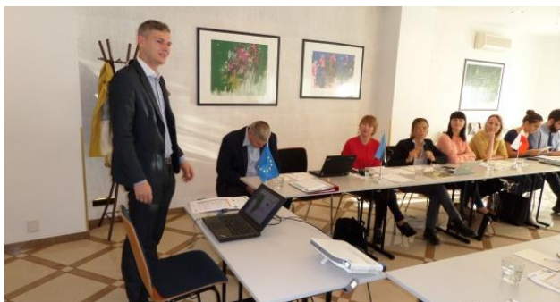
Spotkanie w Tallinie 21-22.09.2016r.

Podczas spotkania partnerzy projektu przedstawili zasady funkcjonowania systemu gospodarki odpadami na terenie swoich miast oraz podczas wizyt studyjnych zapoznali się z systemem gospodarki odpadami funkcjonującym w Tallinie.