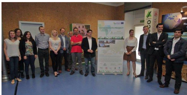
Spotkanie inauguracyjne w Kordobie 26-29.04.2016r.

W ramach Fazy I odbyły się dotychczas spotkania w następujących miastach partnerskich projektu.