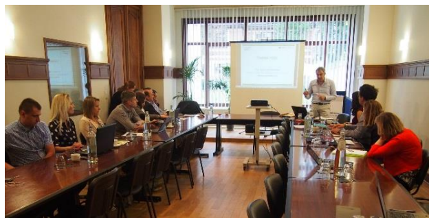
Spotkanie w Brukseli 30.06.2016r.

Podczas spotkania – warsztatów roboczych uczestnicy mieli okazję zapoznać się z analizą doświadczeń, w tym rezultatów wynikających z zakończonych projektów: Pre-waste, Regions4Recycling oraz Miniwaste , dotyczących gospodarowania odpadami komunalnymi w miastach europejskich. Pozwoliło to na porównanie systemów gospodarowania odpadami. Głównymi aspektami analizy były: kompostowanie, recykling oraz zapobieganie powstaniu odpadów ulegających biodegradacji.