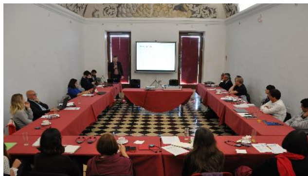
Seminarium Tematyczne w mieście Ibiza 15-16.11.2017 r.

Projekt INTHERWASTE (Międzyregionalna wymiana doświadczeń w zakresie funkcjonowania systemu gospodarowania odpadami komunalnymi w Miastach Europejskiego Dziedzictwa) ma na celu ulepszenie systemu gospodarki odpadami w Miastach Europejskiego Dziedzictwa. Więcej informacji o projekcie: www.interregeurope.eu/intherwaste