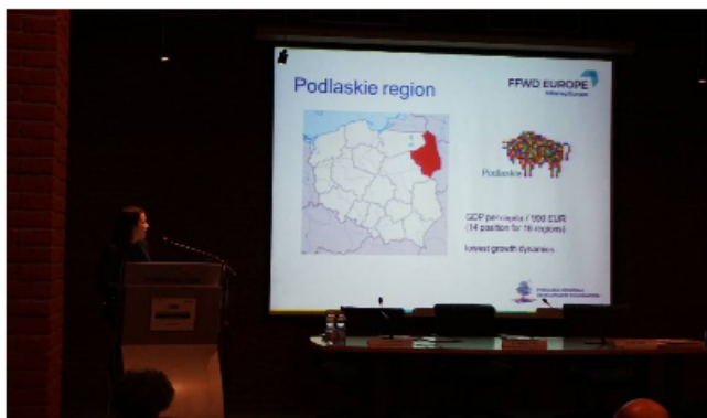
Wizyta studyjna w Turynie w ramach projektu FFWD Europa, marzec 2018