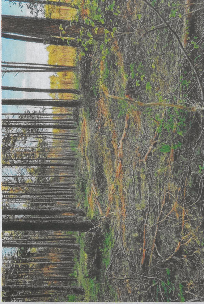
Mieszkańcy Bilczy są zbulwersowani wycinką drzew w okolicznych lasach.

Lesnicy tłumaczą, że wyręb drzew jest konieczny i będzie dalej prowadzony. - Wycinka odbywa się w wielu miejscach w rejonie Kielca a ta w Bilczy wcale nie jest największa - tłumaczy zastępca Nadleśniczego w Kielcach, Woj-