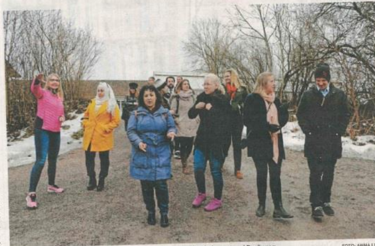
Deltagarna fick se omgivningarna under studiebesöket vid Miljövårdscentrum i Rosängen.

– Det är jättebra att se hur andra länder har hanterat dessa frågor och få tips på hur vi bättre kan stödja de verksamheter som vi har här, säger han.