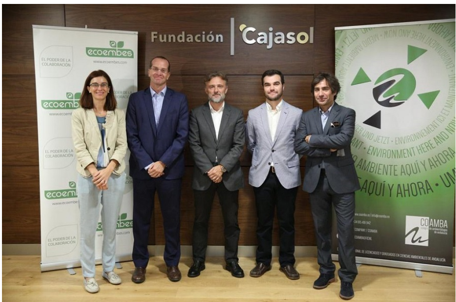
( https://www.residuosprofesional.com/wp-content/uploads/2018/09/jornada-Ecodiseño-compra-publica-verde-fundacion-cajasol-sevilla.jpg )

El consejero de Medio Ambiente aboga por fomentar el diseño ecológico de productos e introducir criterios medioambientales en las licitaciones públicas como medidas esenciales para la transición hacia un modelo de economía circular en la región.