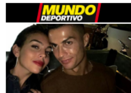
La foto del pasado de Cristiano que ha dejado