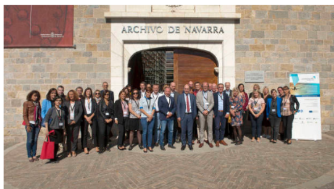
Foto de grupo al comienzo de la jornada de trabajo en el Archivo General.

EP - Miércoles, 3 de Octubre de 2018 - Actualizado a las 17:34h