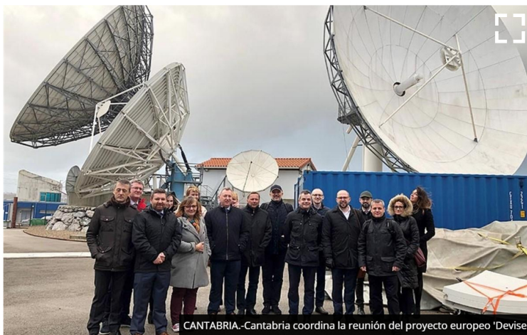
CANTABRIA.-Cantabria coordina la reunión del proyecto europeo 'Devise'