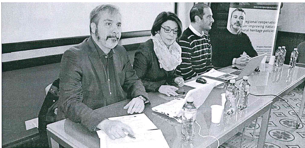
L'incontro sul progetto Land-Sea

CAMPOMARINO. Obiettivo del progetto Land-Sea Sustainability Of The Landsea System For Ecotourism Strategies - è quello di favorire un processo inclusivo, efficace ed efficiente di governance regionale finalizzato allo sviluppo di “sistemi costieri sostenibili”, in grado di preservare gli habitat naturali e