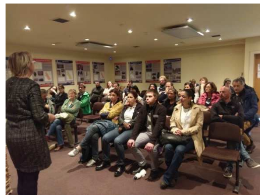
Deelnemers aan het Ierse bezoek kregen uitleg over een scala aan succesvolle praktijkvoorbeelden van GPP. (Zie volgende pagina.)

Tijdens de workshops werd besproken welk effect verplichte GPP-doelen in actieplannen zou hebben. De impact hiervan op lokale kmo's moet bekeken worden: zouden ze in staat zijn om eerlijk te concurreren met grotere leveranciers? Een plotse overschakeling naar een verplicht GPP-model kan ook leiden tot onwil om over te stappen op nieuwe praktijken aan de kant van de aankopers. Misschien kan een eerste stap bestaan uit enkele verplichte groene toekenningscriteria voor bepaalde productcategorieën, om de markt te stimuleren en aankopers vertrouwd te maken met het gebruik van dergelijke toekenningscriteria.