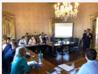
Proyecto europeo de mentorización de pymes tecnológicas

Esta iniciativa de mentorización, que se desarrollará a lo largo del periodo 2020-2021, se enmarca en el proyecto europeo 'Fast Forward Europe', en el que la Región participa a través de Ceeim