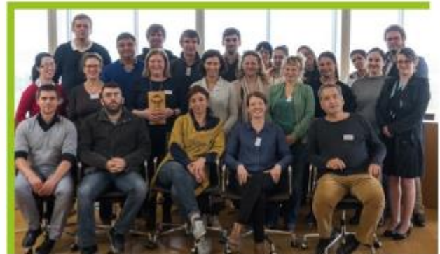
GPP4Growth partneri ar DCCAE kolektīvu Veksfordas pašvaldībā