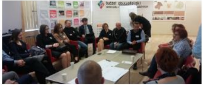
Lodzas reģiona piektā ieinteresēto pušu sanāksme