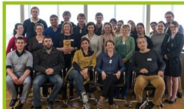
Партньорите по проекта заедно с представители на местни заинтересовани страни в Уексфорд, Ирландия

Това е първата препоръка, идваща от партньорите на GPP Growth, които призовават за промяна в националната правна рамка.