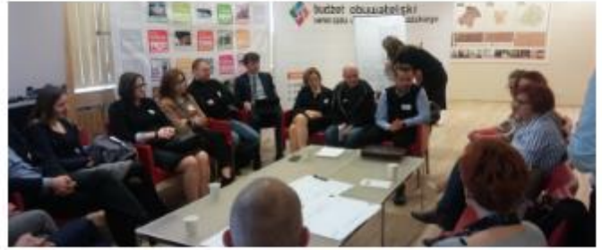
Regione Lodzkie - 5° meeting degli stakeholder