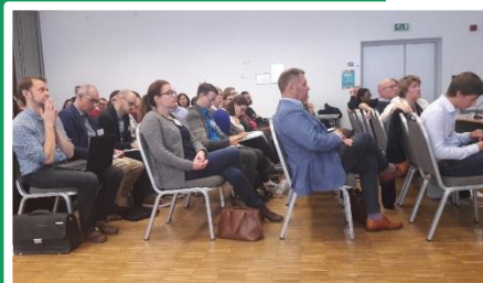
Συνάντηση στην Αμβέρσα του Βελγίου