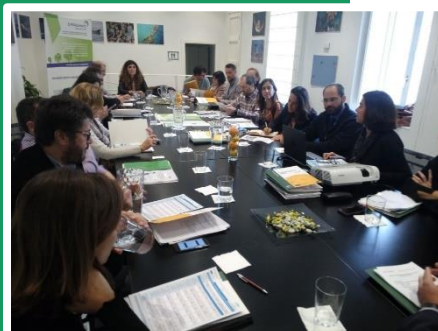
Συνάντηση στη Σεβίλλη, Ανδαλουσία, Ισπανία