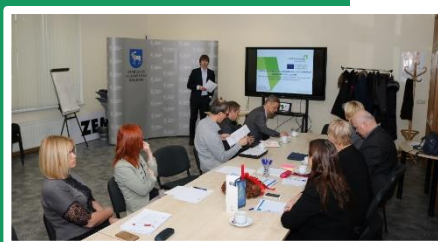
Συνάντηση στη Jelgava, Περιφέρεια Zemgale, Λετονία