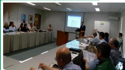
Συνάντηση στο Πανεπιστήμιο Πατρών, Ελλάδα

Το ζήτημα της υποστήριξης υψηλού επιπέδου για τις ΠΔΣ στους δημόσιους φορείς προβλήθηκε σε διάφορες συνεδριάσεις των εταιρών σε διάφορες περιφέρειες εταιρών. Η έλλειψη πολιτικών κινήτρων γύρω από τις ΠΔΣ θεωρείται ότι αποτελεί πραγματικό εμπόδιο για τις ΠΔΣ. Η υποστήριξη των ΠΔΣ από τους πολιτικούς και τη διαχείριση υψηλού επιπέδου στο πλαίσιο των δημόσιων φορέων είναι κρίσιμη, δεδομένου ότι αυτοί οι ενδιαφερόμενοι υποστηρίζουν ορισμένες συστάσεις πολιτικής, εγκρίνουν τη χρηματοδότηση σχεδίων κ.ο.κ. Η υποστήριξη υψηλού επιπέδου από πολιτική, οικονομική, οικοδόμηση ικανοτήτων και ακόμη και από νομική άποψη (σχετικά με οποιαδήποτε αναγκαία αποσαφήνιση του νόμου περί δημοσίων συμβάσεων) είναι όλες κρίσιμες για την επιτυχία των ΠΔΣ να γίνει η συνήθης προσέγγιση στους δημόσιους οργανισμούς.