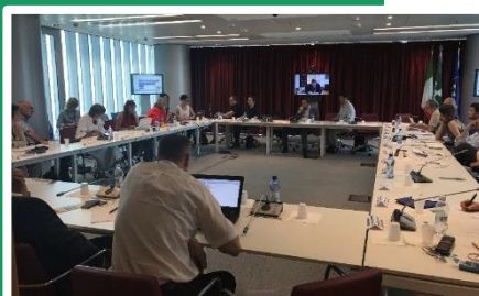
Συνάντηση στο Μιλάνο, Περιφέρεια της Λομβαρδίας, Ιταλία