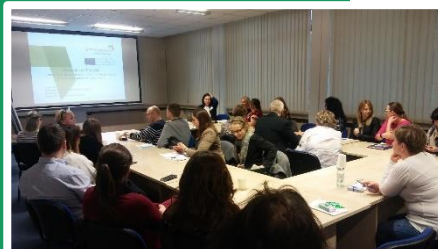
Συνάντηση στο Lodz, Lodzkie, Πολωνία

Η αυξανόμενη συνειδητοποίηση σχετικά με το LCC θα φέρει επίσης στο προσκήνιο τις έννοιες που σχετίζονται με τις ΠΔΣ στο μυαλό των αγοραστών και των προμηθευτών. (συνέχεια στην επόμενη σελίδα ...)