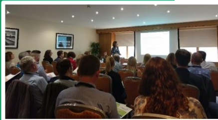
Συνάντηση στο Δουβλίνο, Ιρλανδία

Θα πρέπει επίσης να παρακολουθείται η εφαρμογή των ΠΔΣ . Η μέτρηση, η σύγκριση και ο εορτασμός επιτυχημένων περιπτώσεων υλοποίησης των ΠΔΣ σε δημόσιους οργανισμούς μπορεί να λειτουργήσει ως κινητήριος παράγοντας που θα ενθάρρυνε περισσότερες οργανώσεις να εφαρμόζουν πρακτικές ΠΔΣ στις διαδικασίες προμηθειών τους.