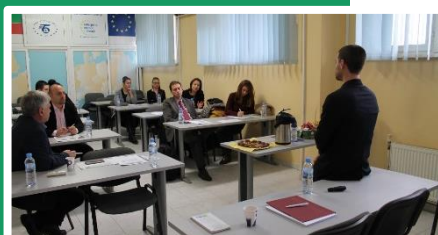
Συνάντηση στη Στάρα Ζαγόρα, Βουλγαρία