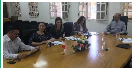
Συνάντηση στη Μάλτα