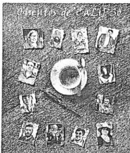
Portada. 'Cuentos del Calipso'.