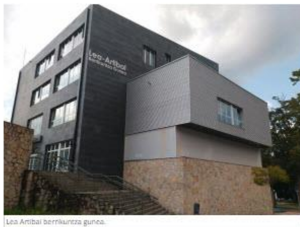
Lea-Artibai berrikuntza gunea.

Cohes3ion proiektu europarra urriaren hasieran jarri zuen martxan BEAZ Bizkaiko Foru Aldundiaren sozietate publikoak. BEAZekin batera ari da lanean Lea-Artibaiko erakundeak.