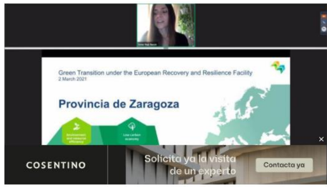
La provincia de Zaragoza, caso de estudio para la transición verde de los Fondos Europeos de Recuperación y Resiliencia. - DIPUTACIÓN DE ZARAGOZA