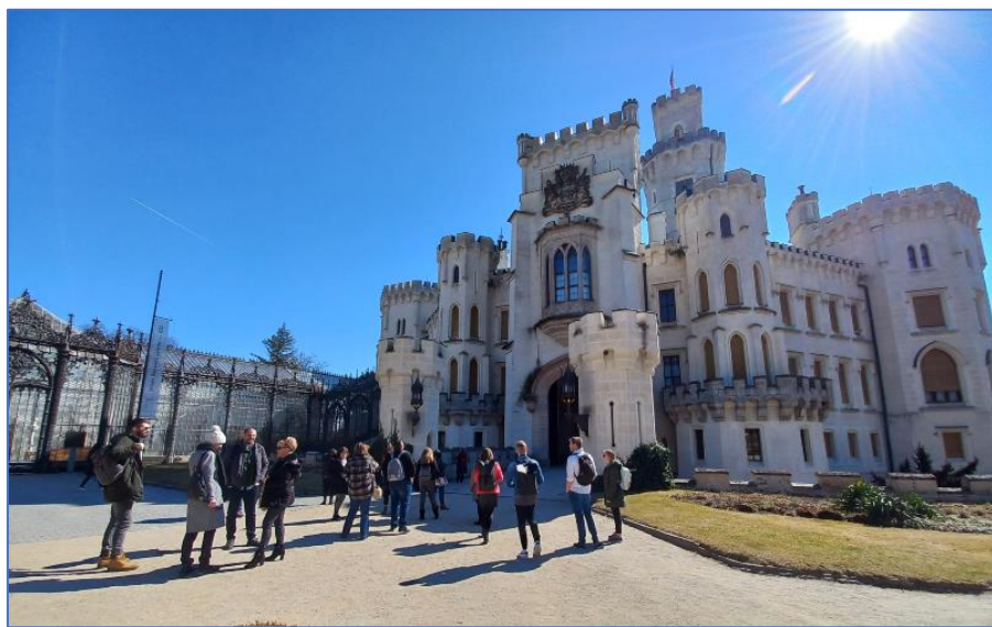
Hluboká nad Vltavou

Projekt MOMAr je realizován v rámci programu INTERREG EUROPE a je spolufinancován z prostředků Evropské unie (ERDF) a Jihočeského kraje