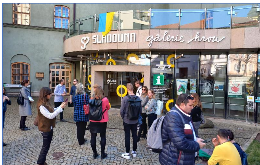
Sladovna v Písku