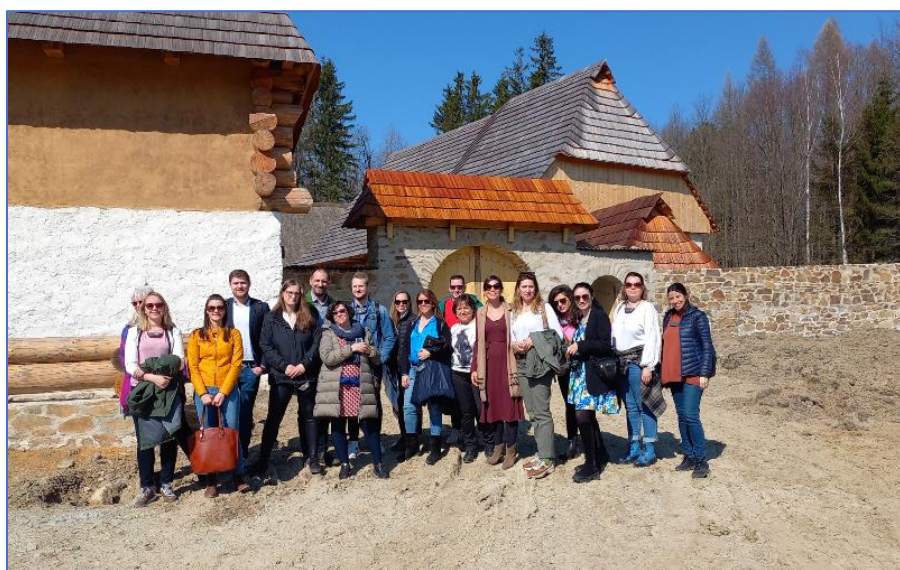
Replika středověkého statku v Trocnově