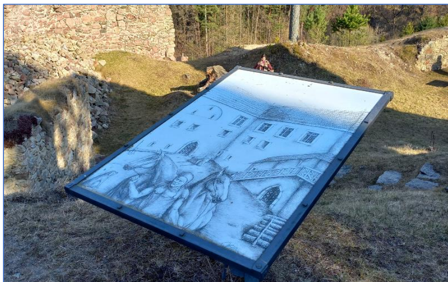
Zřícenina hradu Pořešín

Projekt MOMAr je realizován v rámci programu INTERREG EUROPE a je spolufinancován z prostředků Evropské unie (ERDF) a Jihočeského kraje