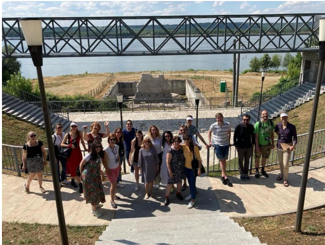
Expertos en patrimonio durante su visita de estudio en Rumanía.

El proyecto europeo MOMAr ("Models of Management for Singular Rural Heritage"), liderado por la Diputación Provincial de Zaragoza (DPZ), ha concluido su última visita de estudio , en esta ocasión en el condado de Mehedinti en Rumanía para conocer de primera mano casos de buenas prácticas en modelos de gestión patrimonial .