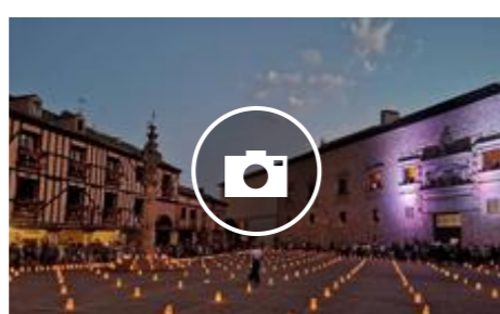
Peñaranda bajo la luz de las velas