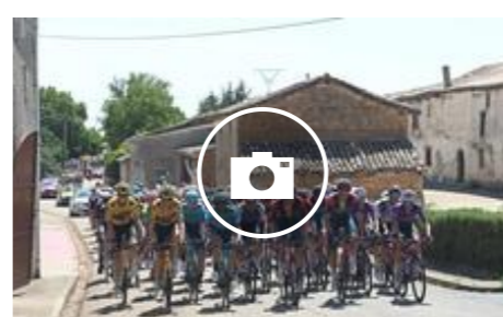
Victoria de Roosen, caída múltiple y Buitrago mantiene el maillot morado